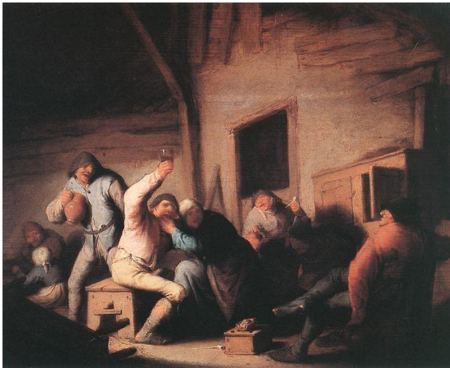
Gemengd herbergbezoek was de norm en zelfs kinderen waren er terug te vinden. Schilderij van Adriaen-Jansz. Van Ostade (Wikimedia Commons)

Heel wat schilderijen met herbergtaferelen uit het ancien régime tonen een gemengd publiek. Zelfs kinderen bezochten regelmatig de herberg. 104