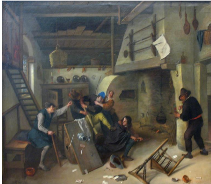
Vechtpartij in een herberg na een kaartspel. Schilderij van Jan Steen

Doordat ontspanning vaak gepaard ging met aanzienlijke hoeveelheden alcohol waren geweld en vechtpartijen schering en inslag. 128 Dat geweld ontstond in de meeste gevallen spontaan en zodoende gebruikten de daders weinig wapens. Zware verwondingen of doodslag kwamen maar weinig voor, 129 al escaleerden de gevechten nu en dan toch. 130 Zo pronkte in 1786 een man in de herberg in Zoerle (Westerlo) met een bebloed mes dat krom stond omdat hij er net een man mee in de rug had gestoken. 131 Het aantal vechtpartijen in herbergen bleek doorheen de achttiende eeuw toe te nemen. 132 Herbergen vormden, vooral in de steden en wanneer ze overnachtingsplek boden, ook ideale schuilplaatsen voor criminelen. Naar alle waarschijnlijkheid vond er heling van gestolen goederen plaats. 133