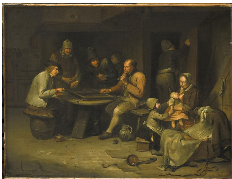
Pijproken was een veelgebruikt ontspanningsmiddel in de herberg. Schilderij van Egbert van Heemskerck (Rijksmuseum Amsterdam).

platteland was de ontspanning gewoonlijk niet intellectueel. De meeste mensen konden in de achttiende eeuw namelijk lezen noch schrijven. 65 Consumptie was wel een erg belangrijke vorm van ontspanning. Eten en vooral drank speelden een grote rol. Tijdens het ancien régime hadden mensen de gewoonte om het merendeel van de tijd vrij sober te leven. Uitzonderlijk gingen ze zich echter te buiten aan uitspattingen met langdurige drank- en eetpartijen. 66 Bier drinken maakte deel uit van quasi alle ontspannende activiteiten. 67 Een bijzonder type genotsmiddel dat mensen als ontspanning consumeerden was tabak. Al sinds het begin van de zeventiende eeuw was tabak roken uit stenen pijpen een wijdverspreide gewoonte in de Zuidelijke Nederlanden, zowel in de stad als op het platteland, vooral onder de lagere klasse. 68