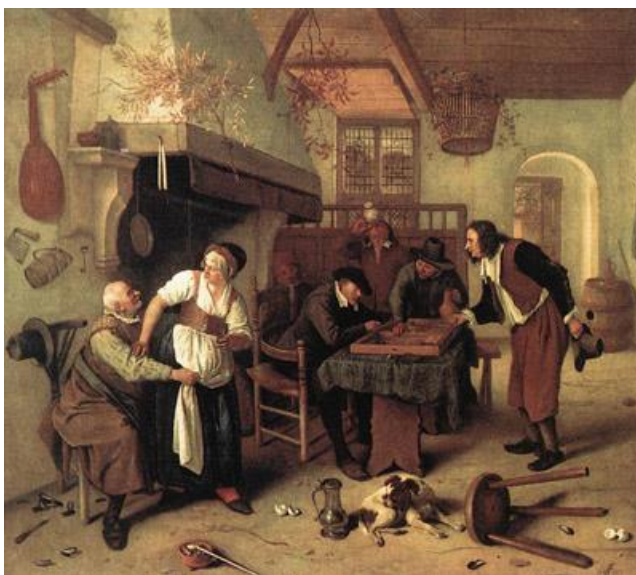
Triptrakspel in de herberg. Schilderij van Jan Steen.

Kansspelen waren een andere opvallende activiteit in de herbergen. Allerhande kansspelen, waren zeer populair tijdens het ancien régime. De voornaamste waren kaartspelen of dobbelen, maar ook het ganzenspel, triktrak (een spel dat lijkt op backgammon), het loterijspel (de voorloper van bingo) of zelfs gewoon kruis of munt waren geliefde spelen. 115 Men gokte om geld maar ook om de werkverdeling te bepalen. 116 De wereldlijke overheid deed aanvankelijk weinig moeite om die activiteiten te beteugelen. 117 Tot het einde van de zeventiende eeuw